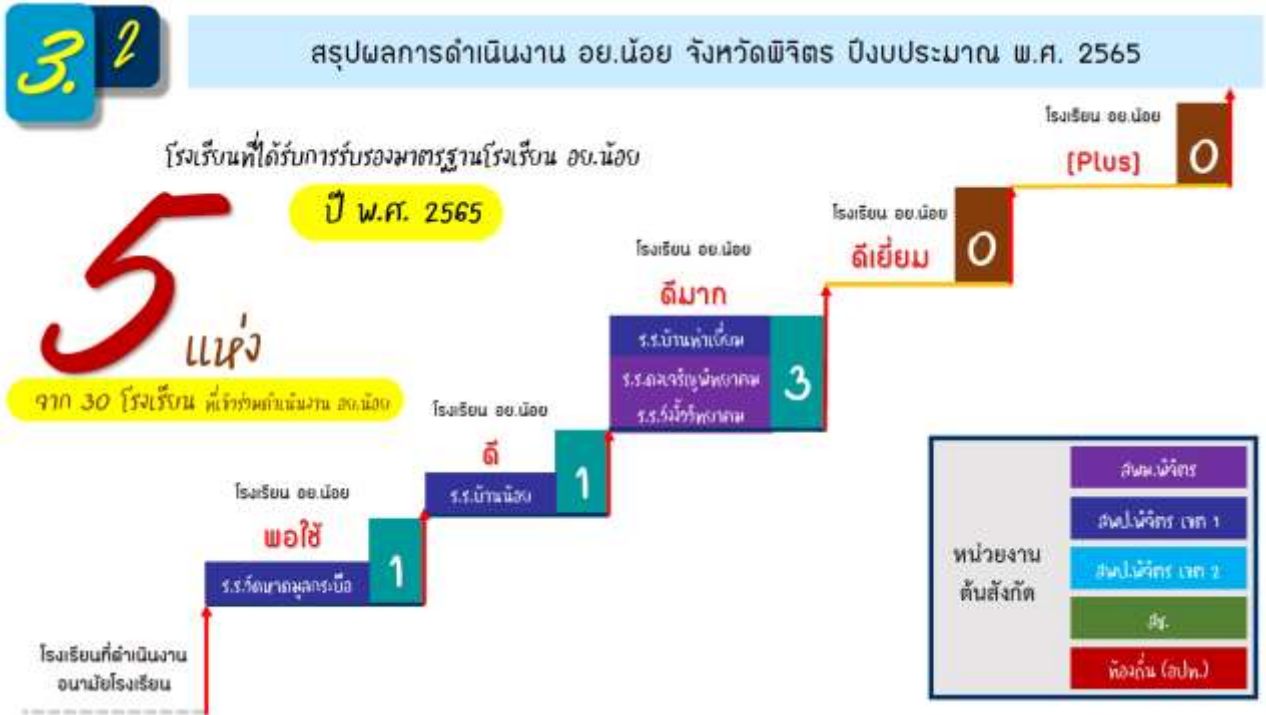
ภาพที่ ๒ แสดงโรงเรียน อย.น้อย ที่ผ่านการประเมินรับรองมาตรฐาน ในปี พ.ศ. ๒๕๖๕