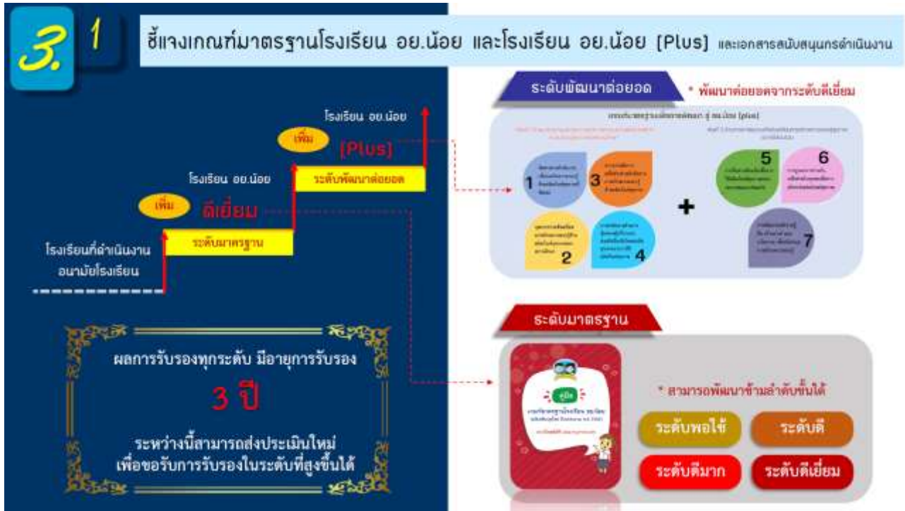
ภาพที่ ๑ แสดงสรุปเกณฑ์มาตรฐานโรงเรียน อย.น้อย

โดยในปีงบประมาณ พ.ศ. ๒๕๖๖ สำนักงานสาธารณสุขจังหวัดพิจิตร ขอให้โรงเรียน อย.น้อย ทุกแห่ง ส่งประเมินมาตรฐานโรงเรียน อย.น้อย และโรงเรียน อย.น้อย พลัส ในระบบ FDACenter ภายในวันที่ ๓๑ กรกฎาคม ๒๕๖๖