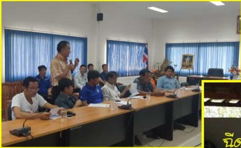
ชี้แจงเรื่องการฉีดวัคซีน/การรายงาน