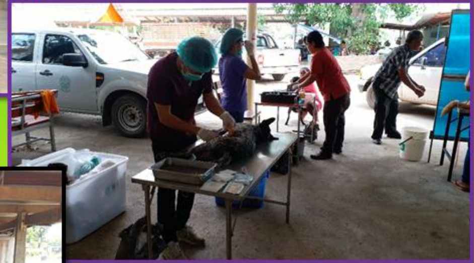
การทำหมันสุนัข/แมว