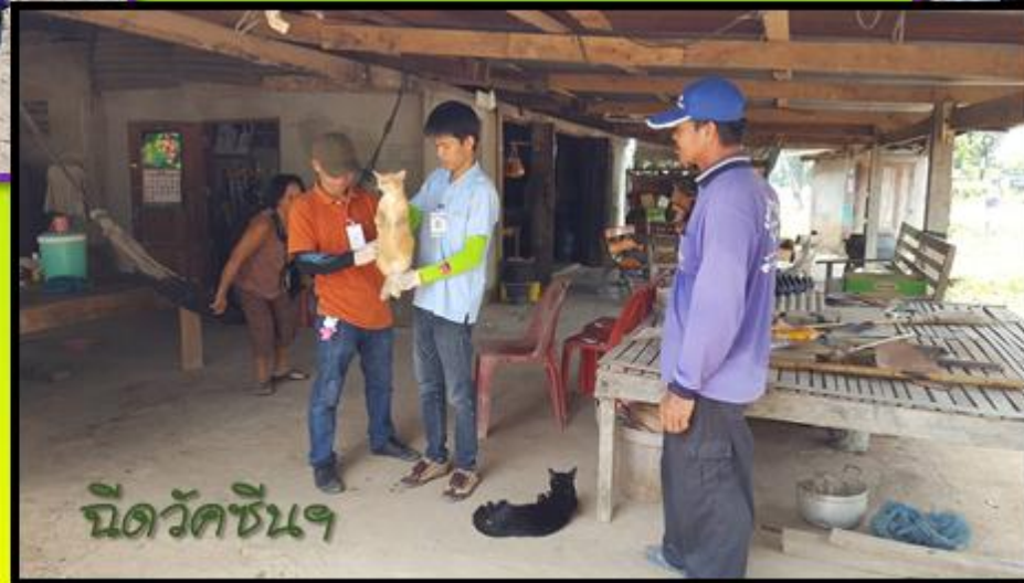
ฉีดวัดซันฯ