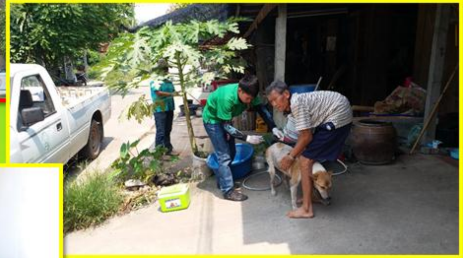
ฉีดวัคซีน