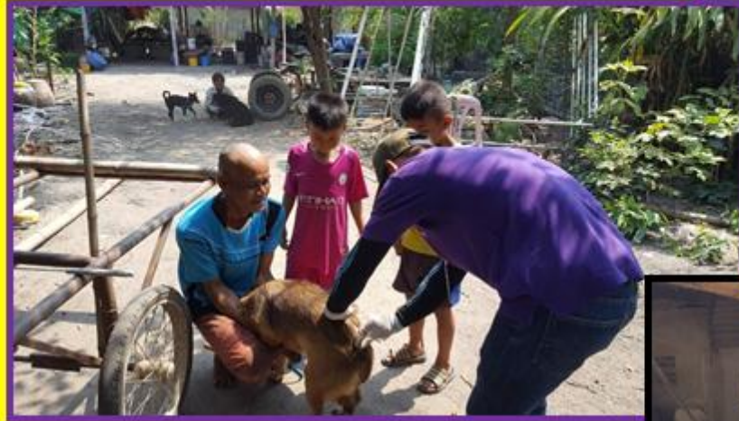
ฉีดวัดซันฯ